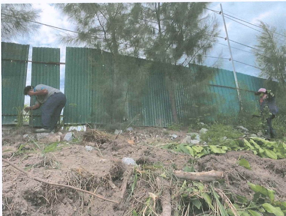
รูปภาพที่ 5 : ปักต้นไม้บริเวณโรงโม่หิน