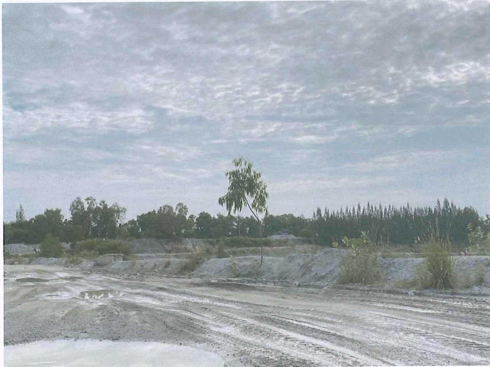
รูปภาพ: การเตรียมพื้นที่ปลูกไม้แนวป้องกันเขตประทานบัตร