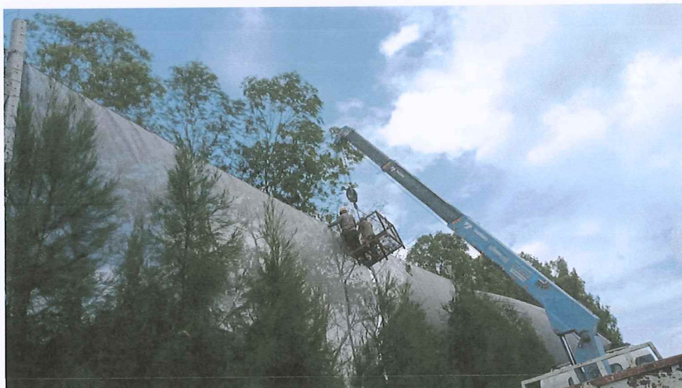
รูปภาพที่ 6 : บำรุงรักษาต้นไม้เดิมและซ่อมแซมม่านที่ชำรุด