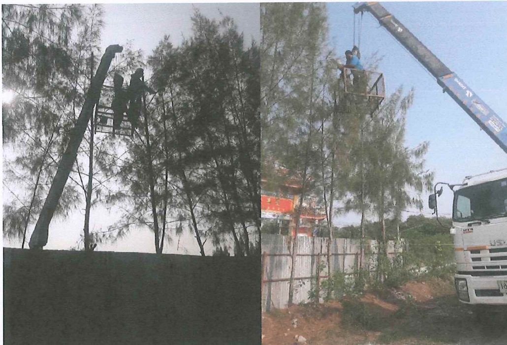
รูปภาพ: ดูแลต้นบำรุงรักษาต้นไม้แนวประทานบัตร