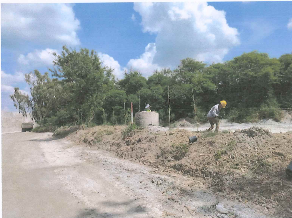
รูปภาพที่ 2 : ปลุกต้นไม้บริเวณขอบบ่อเหมือง