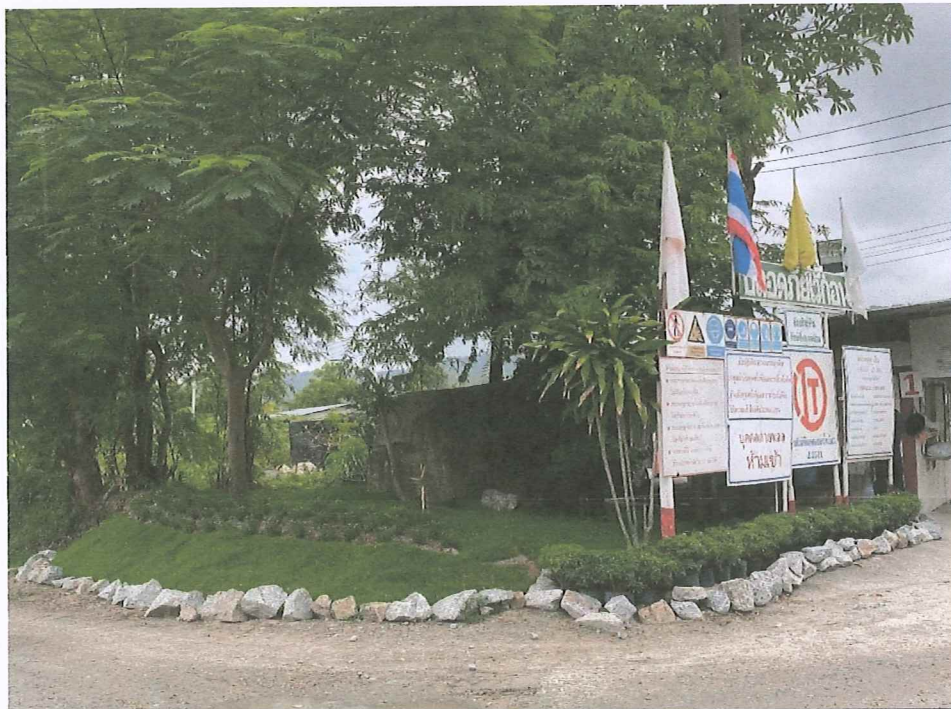
รูปภาพ: ปรับปรุงทัศนียภาพสำนักงานและบ้านพักพนักงาน