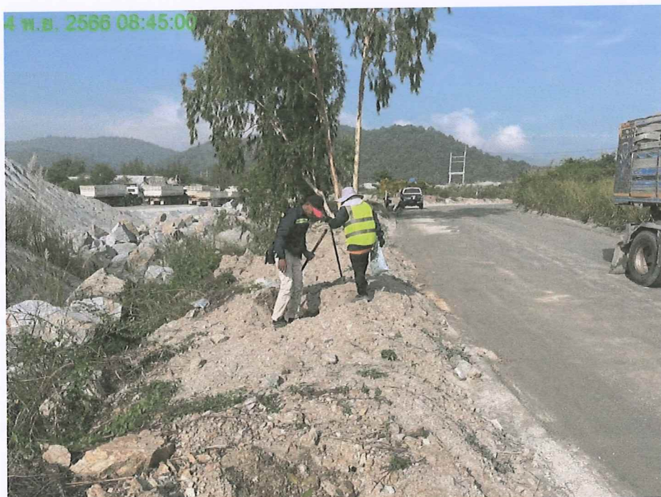
รูปภาพที่ 4 : บำรุงรักษาต้นไม้บริเวณขอบสะพานบัตร