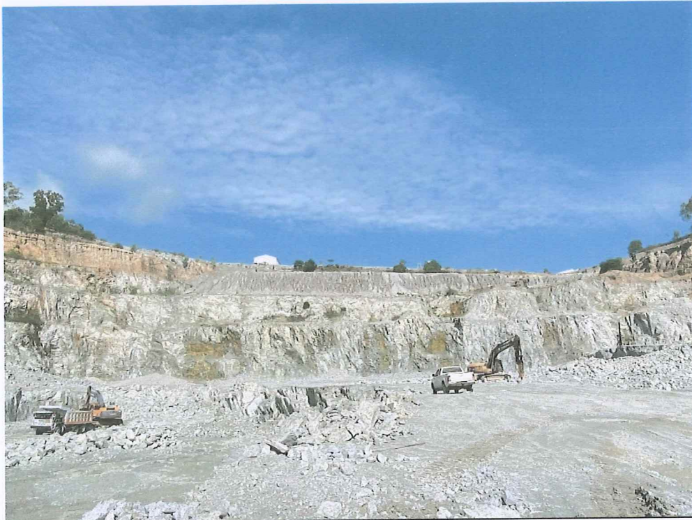
รูปภาพที่ 1 : หน้าเหมืองปัจจุบันของโครงการ